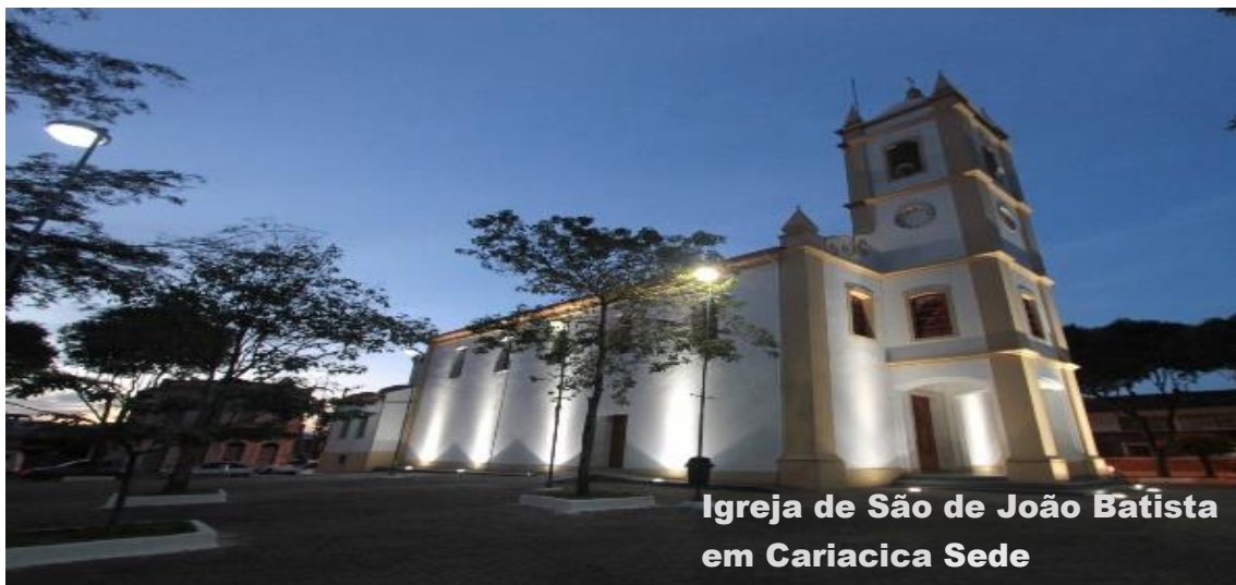
Igreja de São de João Batista em Cariacica Sede

Presidente do Conselho Municipal de Política Cultural de Cariacica